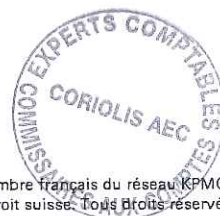
Tableau 2057 – voir Annexe 3.