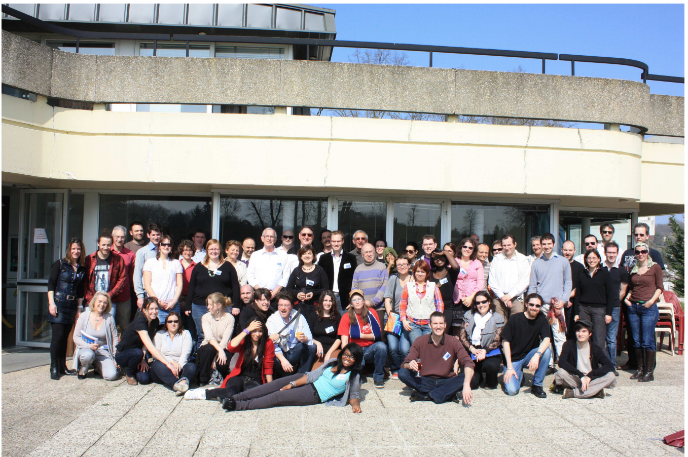
Centre International de Séjour de Bois le Roi le 24 mars 2012

Centre International de Séjour de Bois le Roi