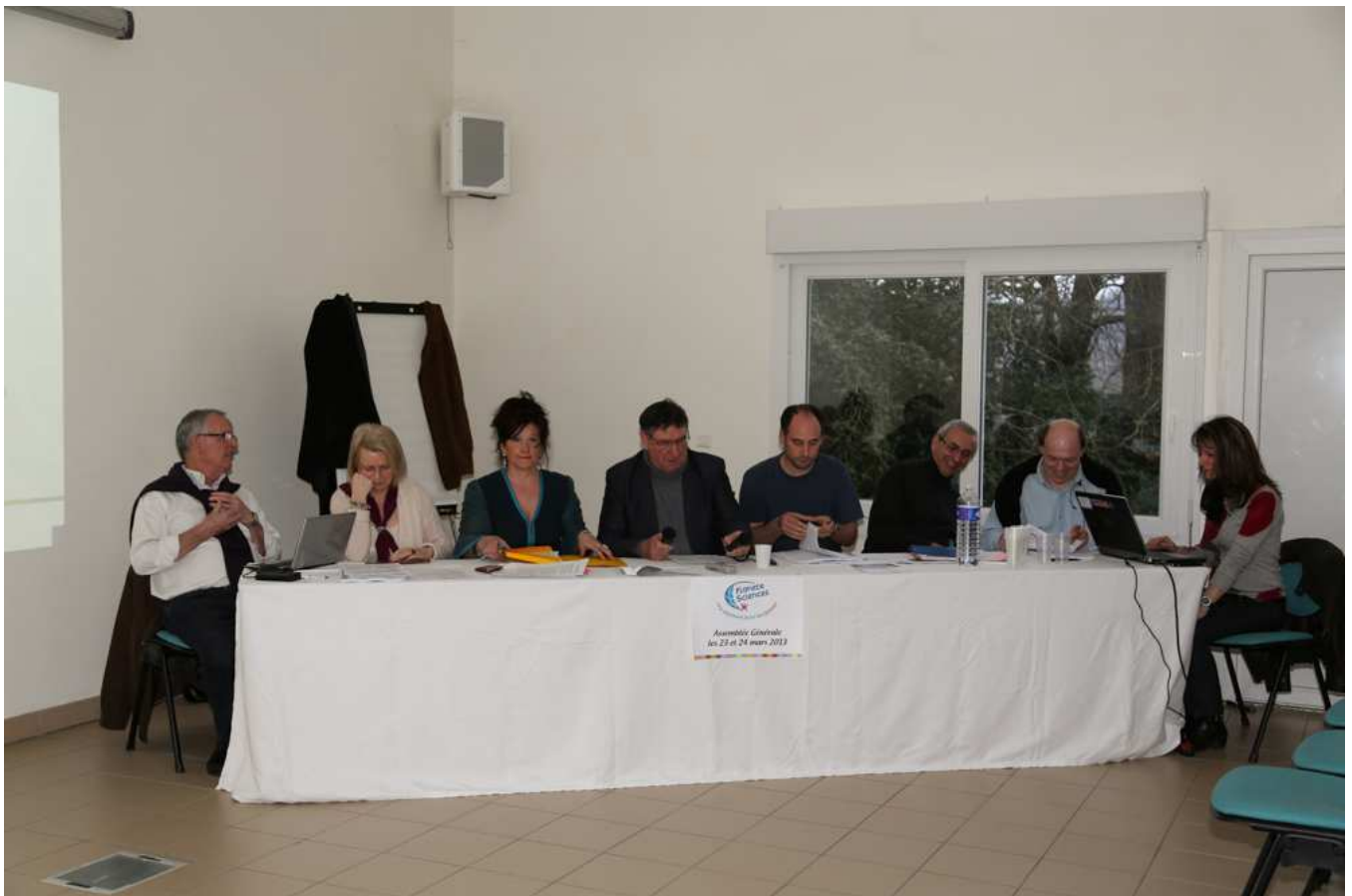
Centre International de Séjour de Bois le Roi le 23 mars 2013